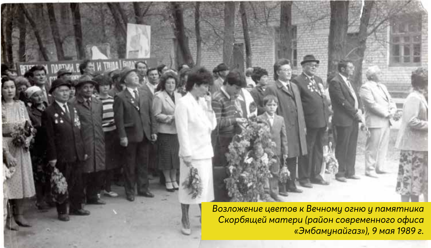
Возложение цветов к Вечному огню у памятника Скорбящей матери (район современного офиса «Эмбаунайгаз»), 9 мая 1989 г.