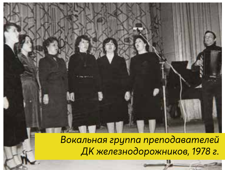
Вокальная группа преподавателей ДК железнодорожников, 1978 г.

К тому же, собирала всех бабушек и детей на свои выступления: посёлок глухой, какая там