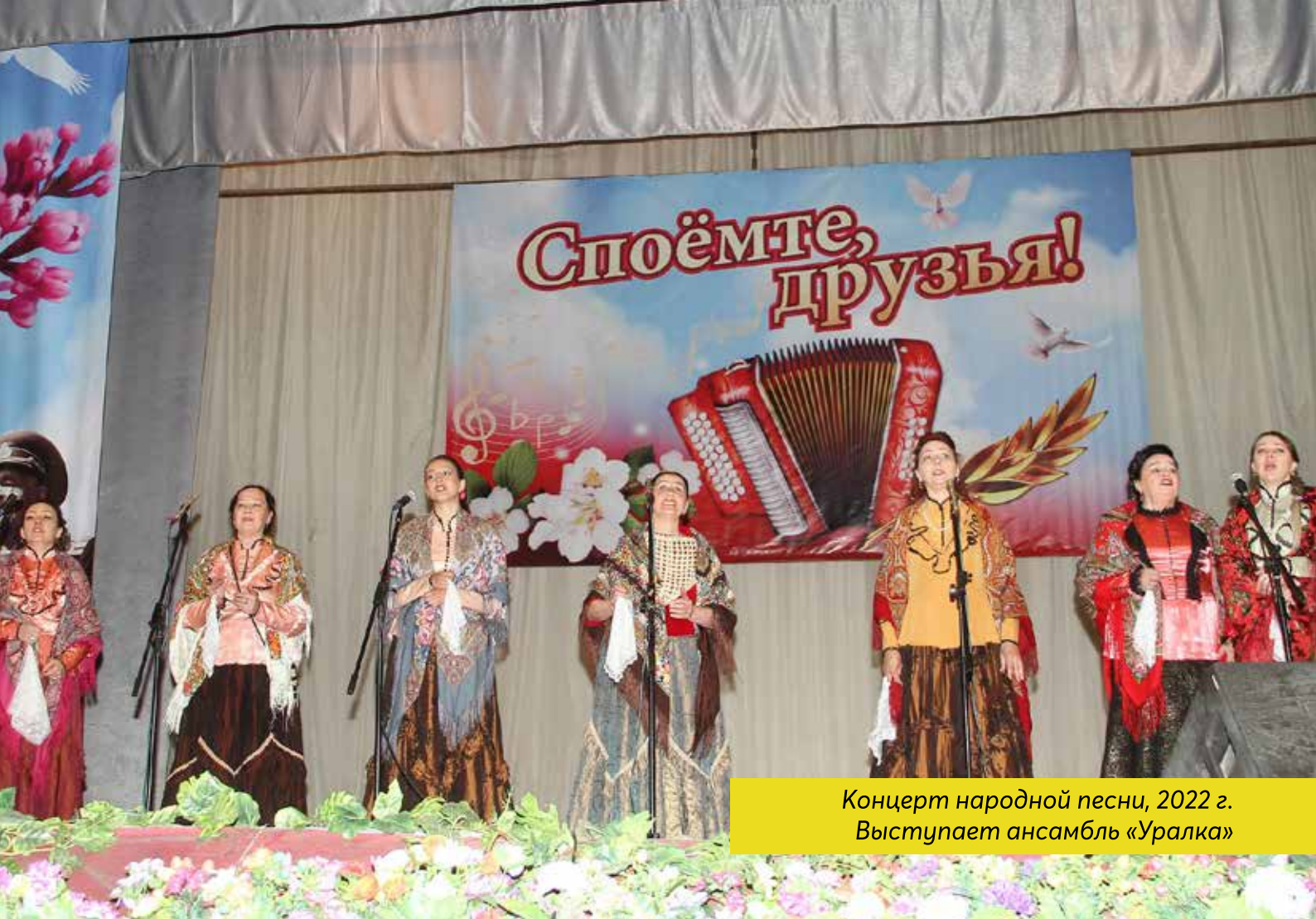
Концерт народной песни, 2022 г. Выступает ансамбль «Уралка»

пучих песках в Восточном Казахстане). Мама начала работать учителем в Щаповской школе. Так Уральск стал для меня родным домом.