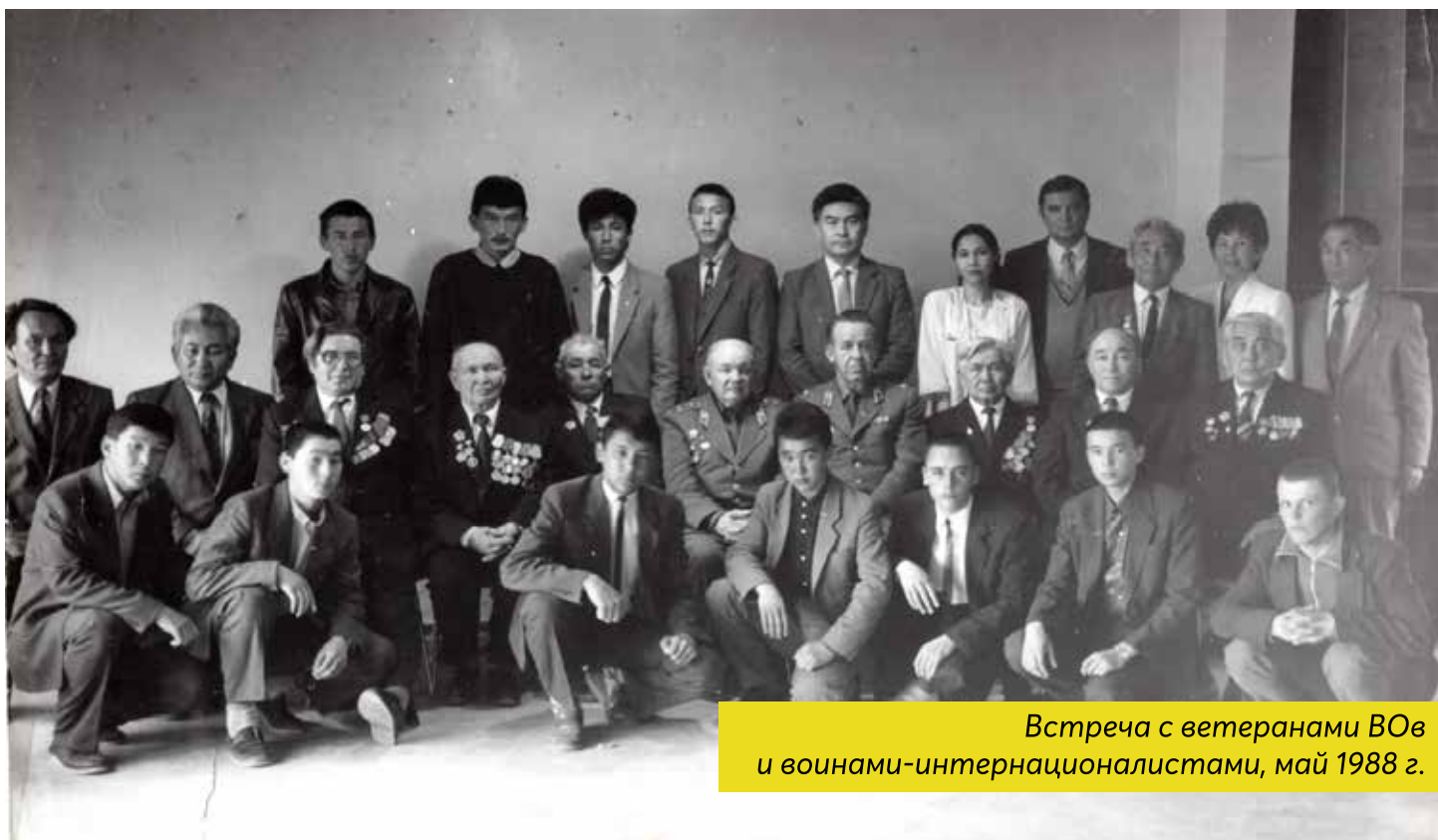
Встреча с ветеранами ВОВ и воинами-интернационалистами, май 1988 г.

Обратим внимание на его имя Жамбыл, которое означает «крепость», «крепкий», «статный», имя имеет монгольские или тюркские корни. По другой версии имя переводится как «стальная душа» или «красивая душа», имя образовано от персидского слова جان (жан – «душа» или «жизнь») или арабского слова جميل (Джамил – «красивый») в комбинации с арабским словом دالوپ (Полад – «сталь»). Отчество Саулебекович