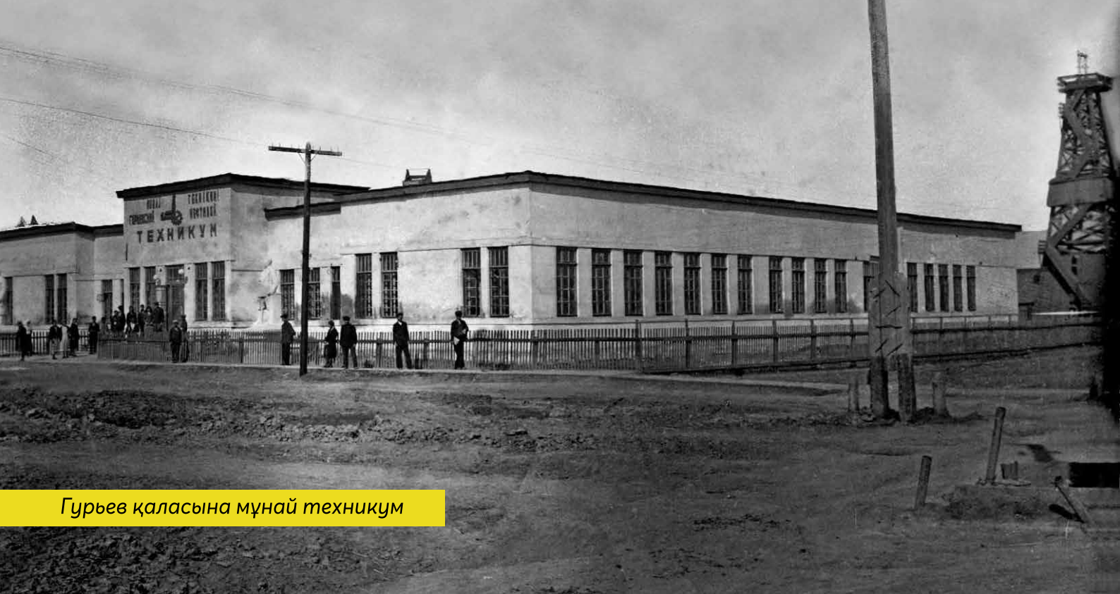
Гурьев қаласына мұнай техникум