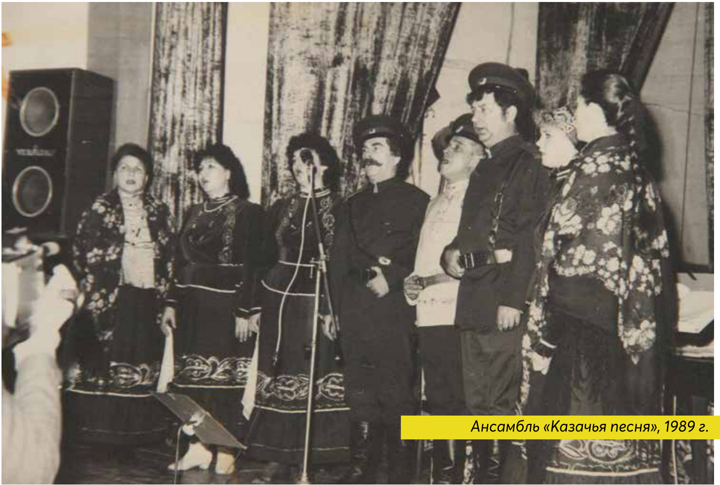
Ансамбль «Казачья песня», 1989 г.