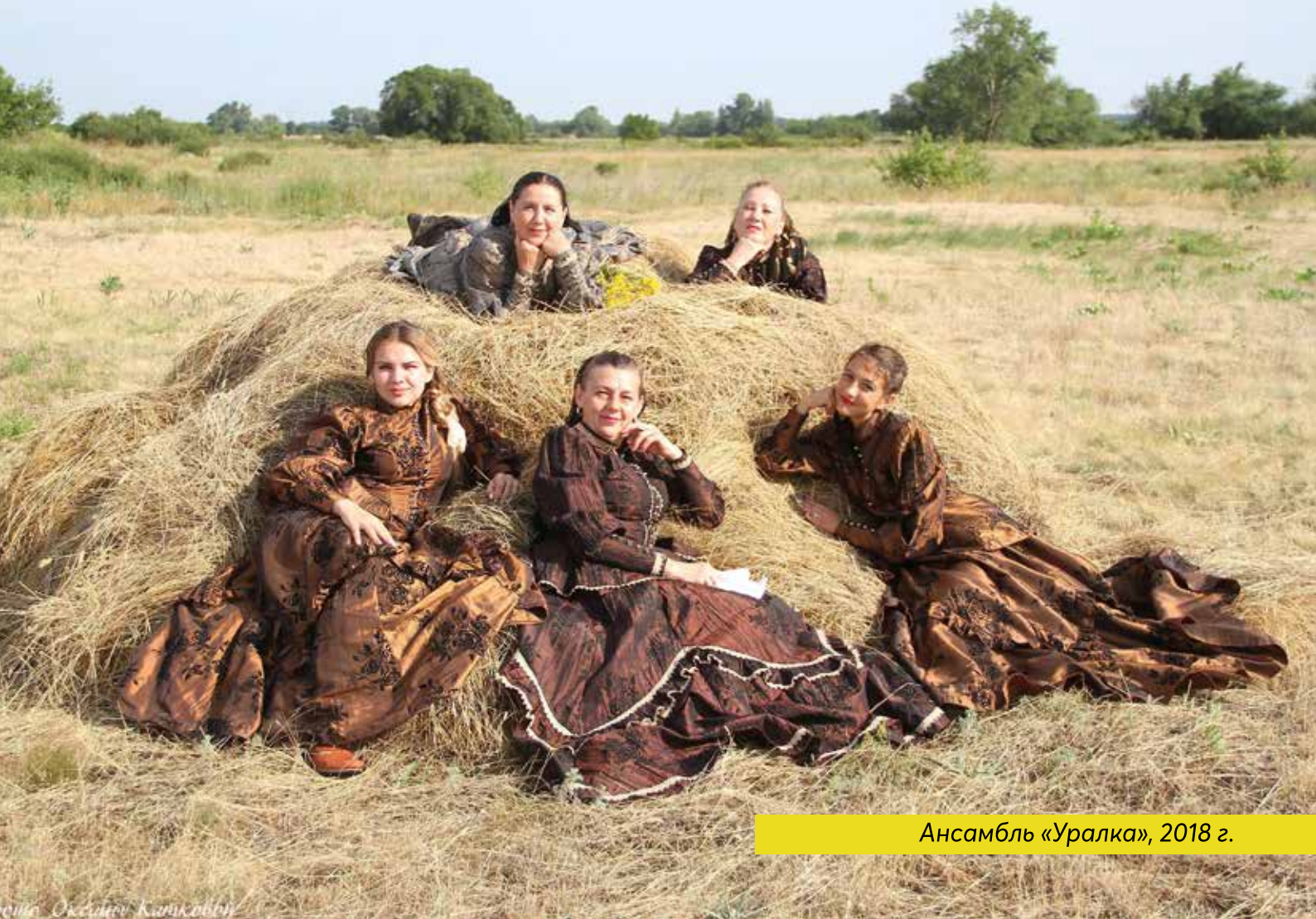
Ансамбль «Уралка», 2018 г.

пления на фестивалях, поездки в города Казахстана и России. К своему двадцатипятилетнему юбилею ансамбль «Казачья песня» подошёл достойно. Его очень любили и ценили уральцы. Каждый год было по пять-шесть выездов на фестивали. Оренбург – каждый год, с 2000 года ежегодно Вешенская станица – на фестиваль казачьей песни «Шолоховская весна».