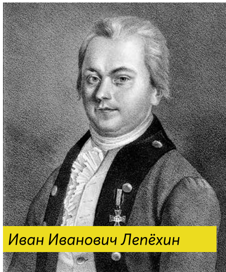
Иван Иванович Лепёхин