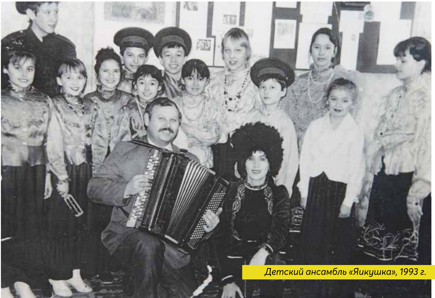
Детский ансамбль «Яикушка», 1993 г.