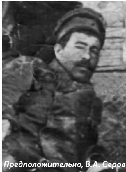
Предположительно, В.А. Серов