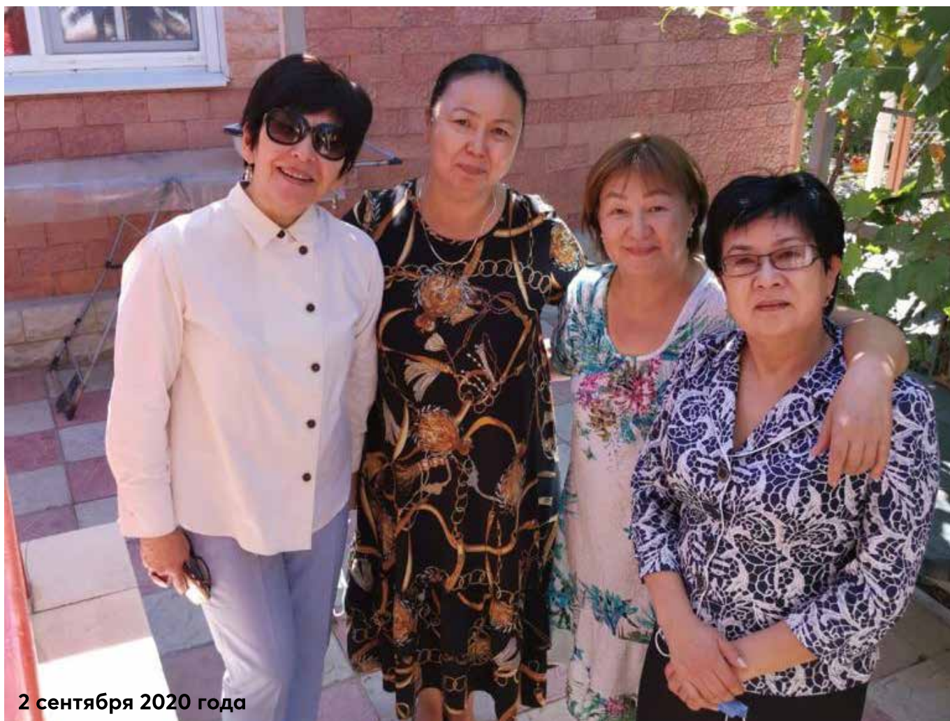
2 сентября 2020 года

ботали и работают по специальности в городе и районах нашей области и за её пределами. Они стали прекрасными работниками в сфере образования, хорошими учителями. И даже в сфере бизнеса преуспели, благодаря билингвизму. Все грамотно владеют и русским, и казахским языками. Некоторые уже на заслуженном отдыхе, но продолжают работать.