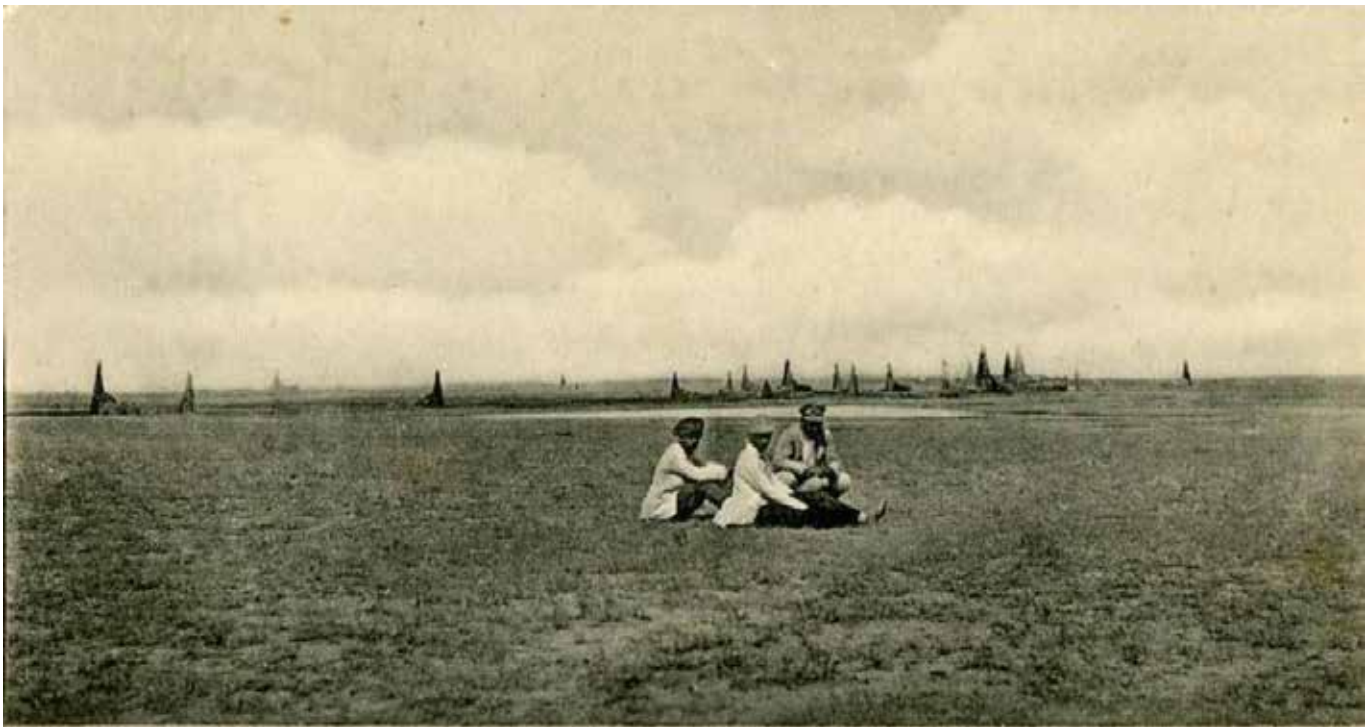
Доссорь. Гурьев. у. Урал. обл.