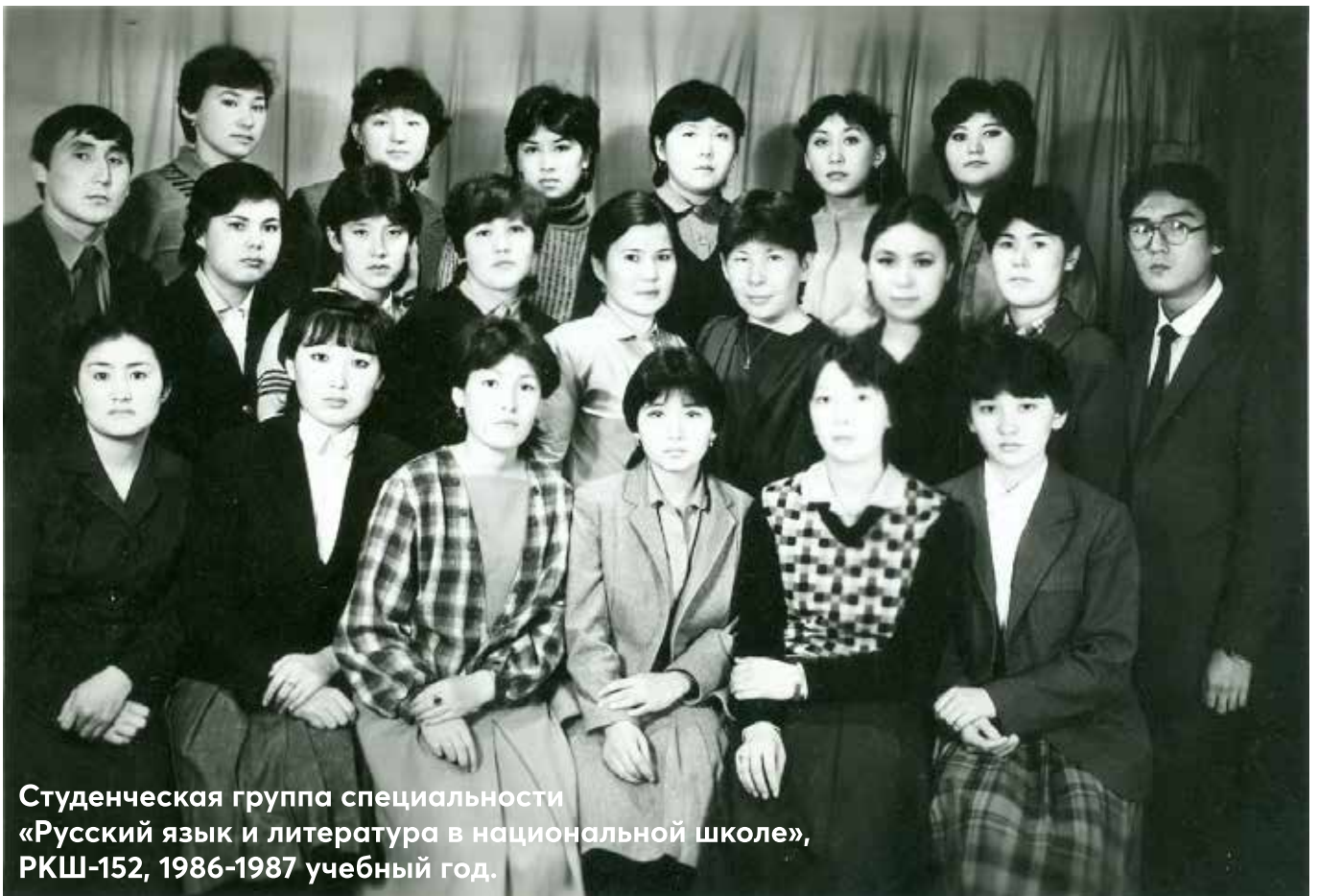
Студенческая группа специальности «Русский язык и литература в национальной школе», РКШ-152, 1986-1987 учебный год.

Студенческая жизнь – это необыкновенное время, время открытий, накопления знаний, яркая и запоминающаяся пора. Именно студенческие годы самые интересные и незабываемые. Это время наполнено романтикой, беззаботностью, рвением к знаниям.