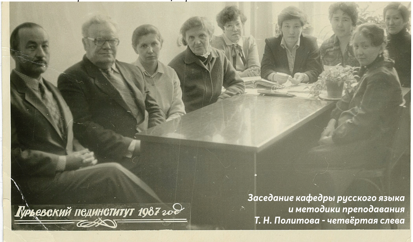
Гурьевский пединститут 1987 год