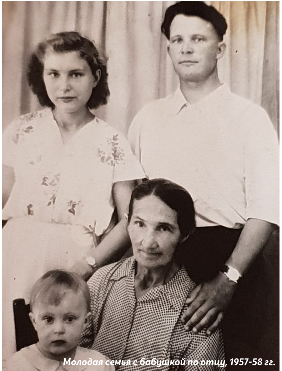
Молодая семья с бабушкой по отцу, 1957-58 гг.

Мама всегда была смешливой, задорной, энергичной, какой я знала её в моём детстве. И ещё она очень любила петь: голос у неё был высокий, звонкий, чистый. Как она стремилась к знаниям! Часто рассказывала, как долго мечтала записаться в библиотеку, будучи подростком. И когда смогла это сделать, была очень счастлива. Она с трепетом относилась к книгам, читала их целыми стопками и гордилась тем, что является читателем библиотеки. Всю жизнь читала взахлёб, несмотря на тяжёлую домашнюю женскую работу. Страсть к книгам передалась и мне, и моим детям. Все мы –