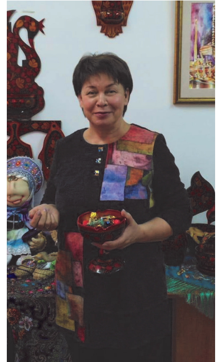
Гурьев, и его жители – семейные портреты, есть и фото районов.