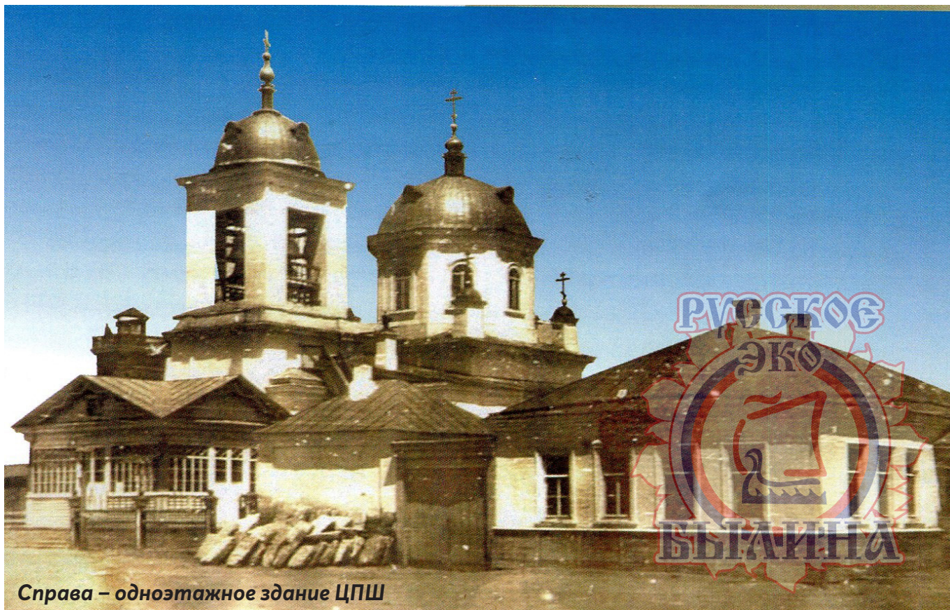
Справа – одноэтажное здание ЦПШ

обошёл, на мои вопросы отвечал удовлетворительно, водил меня в алтарь, показывал церковную утварь и книги, которые все печатные православного издания».