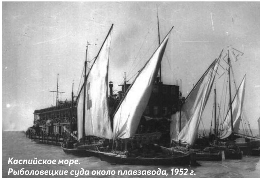
Каспийское море. Рыболовецкие суда около плавзавода, 1952 г.