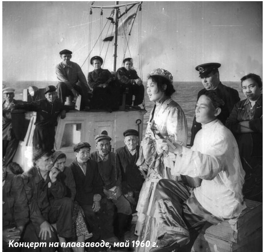
Концерт на плавзаводе, май 1960 г.

рыбы, и это стало заметно уже в конце 50-х годов. Рыба, в основном частичковая, особенно вобла, лещ и сазанчик, стала маломерной (так называемый незаконник). Сами рыбаки поняли, что такую рыбу ловить нельзя. А уловы осетровых вообще резко упали: белуги, осётры, севрюги ловились редкими единицами.