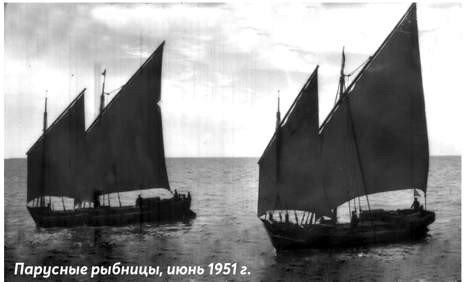
Парусные рыбницы, июнь 1951 г.

На плавзаводе обязательно были медпункт и аптека, врач, медсестра. Если рыбак заболел, то его везли к врачу на плавзавод, где ему оказывалась