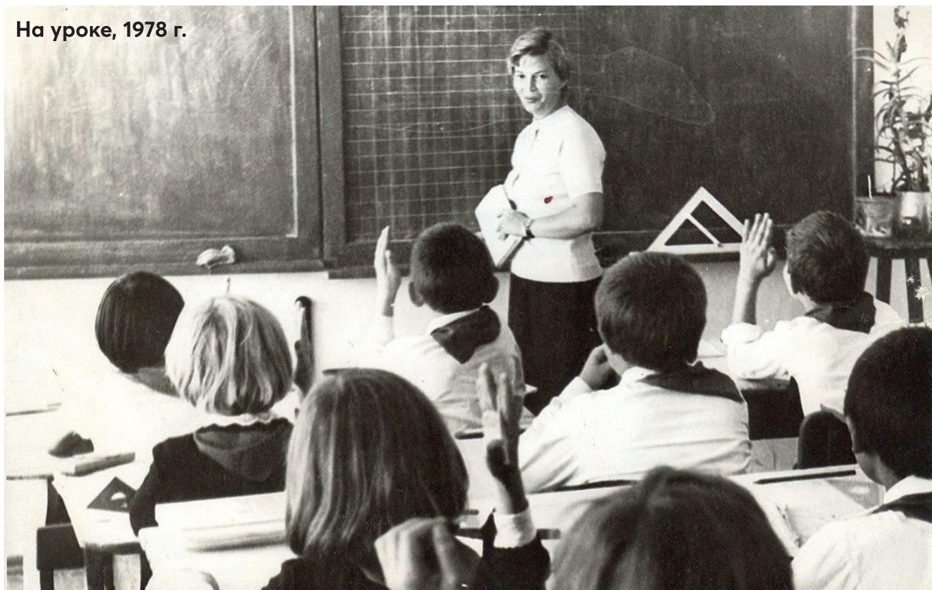
На уроке, 1978 г.