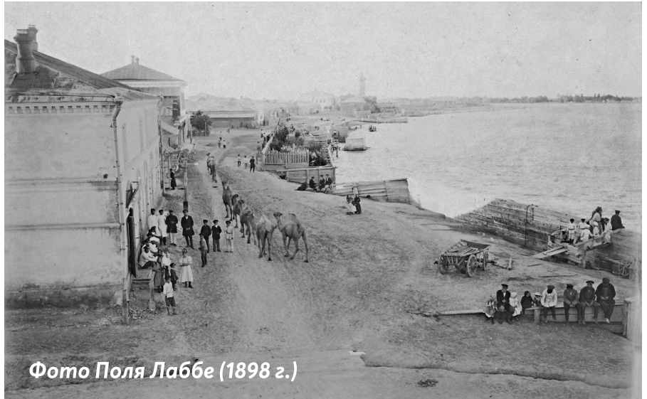
Фото Поля Лаббе (1898 г.)

Товары, которые в Гурьев не производятся, привозятся из г. Астрахани морем: хлеб, овёс, крупа, вино, сахар, чай, кофе, пряности, сласти, табак, красный товар, обувь, железо, мелочной и проч. Привоз товаров бывает весною, летом и осенью, и из Уральска сухопутно зимою эти же товары. Товары привозятся иногородными лицами и казаками, каждый для своей лавки, иные же снабжают товарами других торговцев, которые из Гурьева не каждый год ездят в Астрахань и в Нижний Новгород на ярмарку.