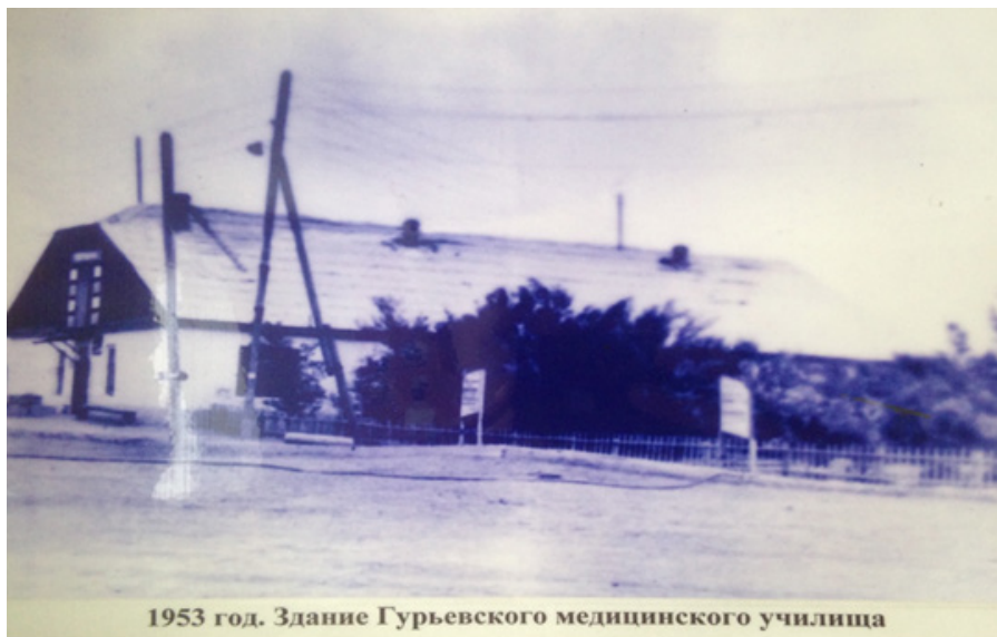
1953 год. Здание Гурьевского медицинского училища

ставали по обвинению во вредительстве, приговорив к трём годам лишения свободы с последующей ссылкой. В составе «тройки» НКВД был, кстати, будущий писатель, автор популярных при Союзе «Записок следователя» Лев Шейнин.