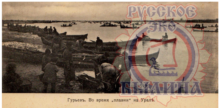
Гурьев. Во время „плавни“ на Уралѣ.

море в назначенный начальник день, каждый казак выезжает из своего двора в телеге в одну лошадь, семейство его – жена и дети – садятся тоже с ним, идут на Ракушечью пристань, отстоящую от Гурьева на 7 вёрст к западу, по приезде на пристань они прощаются с своими родными и расстаются. Каждый казак входит в лодку со своей артелью и пускается в открытое море. Морские суда заблаговременно исправлены